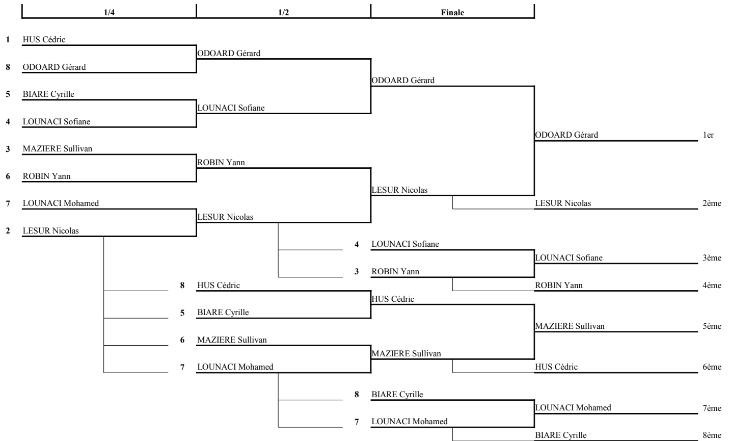
TABLEAU PERDANT DU TOURNOI HANDICAPE DU 25 / 03 / 2010